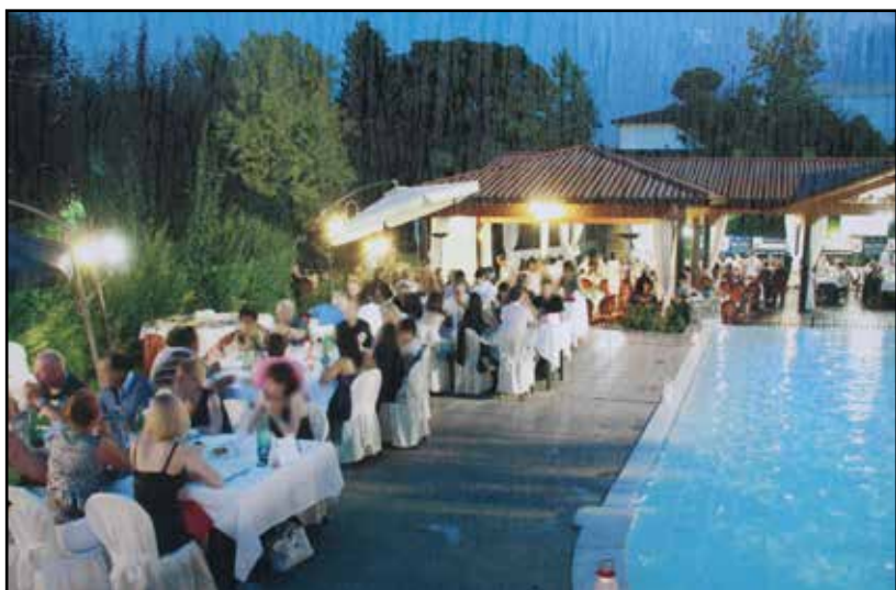
Cena con musica a bordo piscina. Allietera la lunga serata l'ap-prezzata orchestra Zamboni. È gradita la prenotazione: tel. 030 961735.

La Direzione del Green Park Boschetti organizza per VENERDÌ 22 SETTEMBRE l'addio a questa calda estate con una serata nell'ormai consueta cornice a bordo piscina. Novità in entrata del noto ristorante monteclarese tre nuove fontane inserite nel parco molto suggestivo e ricco di situazioni per foto ricordo per gli sposi e non solo. Viene proposto il tradizione menù a buffet seguito da altre nuove portate, un nuovo biglietto da visita per una ristorazione già ricca ed apprezzata.