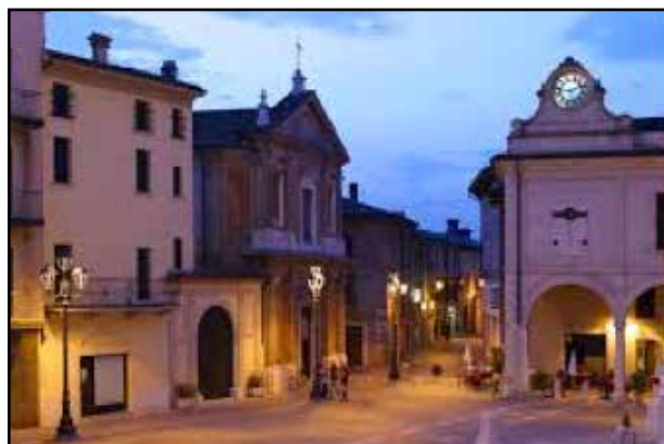
Uno scorcio del centro di Montichiari.