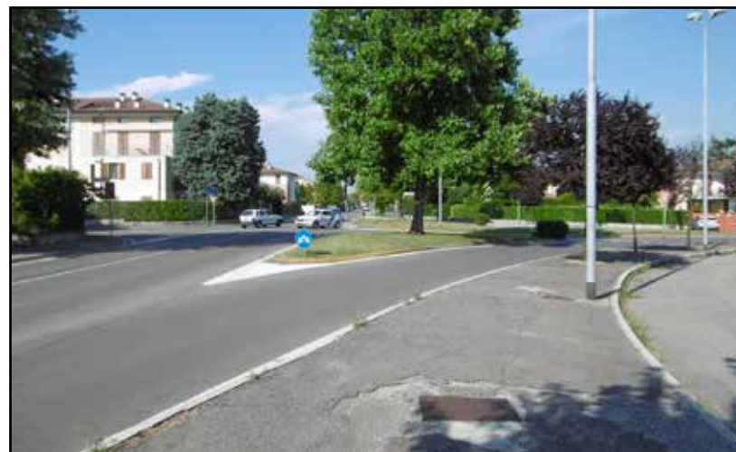
La nuova rotonda riguarda l'intersezione di via C. Battisti con via Santo Casasopra e via Nazario Sauro.

Iniziati i primi interventi, dopo il via libera della Soprintendenza, per la messa in sicurezza delle mura del Castello Bonoris . Con il restauro conservativo verranno rafforzate e consolidate le mura del lato ovest che saran-