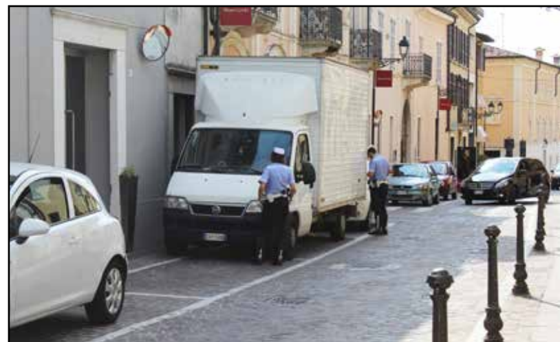
Vigili nell'espletamento delle loro funzioni in via Martiri della Libertà.