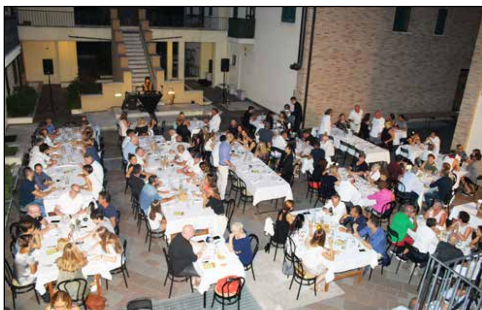
Partecipanti ad una delle serate organizzate dalla Bottega delle Carni.