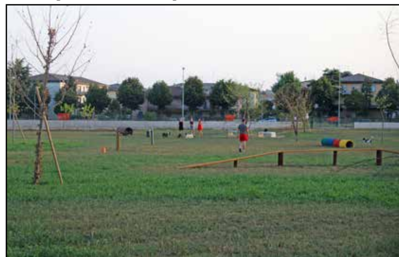
L'area attrezzata per cani in zona Allende.

Purtroppo sono pervenute nella nostra redazione segnalazioni di danni vandalici con bottiglie rotte conficcate nell'erba per far male ai cani.